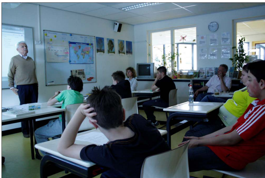
Themaweek Tweede Wereldoorlog

klas wordt gewerkt met een leerkracht en een gedragsbegeleider. Het doel van de Kolibrie is om de leerlingen na een maximale periode van twee jaar in te laten stromen naar een reguliere vorm van speciaal onderwijs (veelal naar de Lasenberg). Om toegelaten te kunnen worden, dient er een REC-4 indicatie en een zorgindicatie (in combinatie met een tijdelijke ontheffing van de leerplicht) aanwezig te zijn. De zorgindicatie is via het CIZ verkrijgbaar.